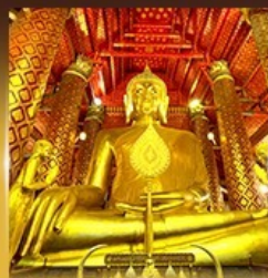
วัดพนมเชิงวรวิหาร