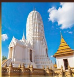
วัดพุทธไสยาสน์