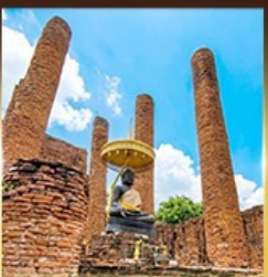
วัดธรรมิกราช