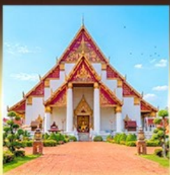
วิหารพระมงคลมิ่งมิตร