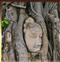
วัดมหาธาตุ