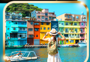
หมู่บ้านประมงเจียงปิ่น