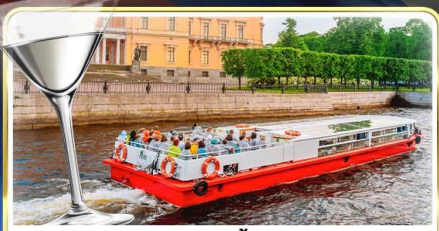
ล่องเรือแม่น้ำเนวา พร้อมลิ้ม Vodka Tasting

📅 เดินทาง : 14-21 มิ.ย.69 / 28 มิ.ย.-05 ก.ค.69 / 24-31 ก.ค.69