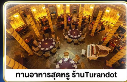
ทานอาหารสุดหรู ร้านอาหารTurandot