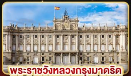
พระราชวังหลวงกรุงมาดริด