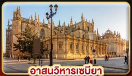
อาสนวิหารเซบิยา