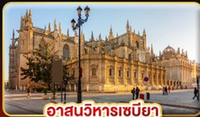
อาสนวิหารเซบิยา