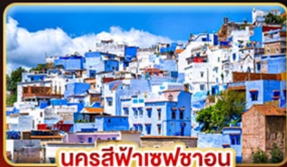
นครสีฟ้าเซฟซาอูน

📅 เดินทาง: 18-27 ต.ค. | 02-11 ธ.ค. 69 27 ธ.ค. 69 - 05 ม.ค. 70