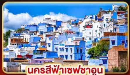
นครสีฟ้าเชฟชาอูน

📅 เดินทาง: 18-27 ต.ค. | 02-11 ธ.ค. 69 27 ธ.ค. 69 - 05 ม.ค. 70