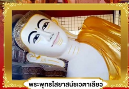
พระพุทธรูปไสยาสน์ชเวดาคะเลียว