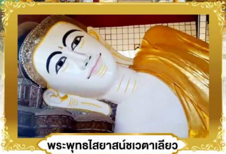
พระพุทธรูปไสยาสน์ชเวตาเลียว