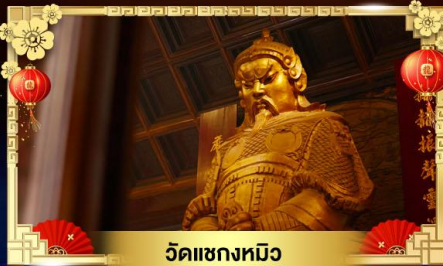
วัดแขกหมิว