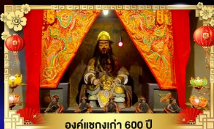
องค์แชกงเก่า 600 ปี