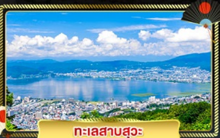
ทะเลสาบสุวะ