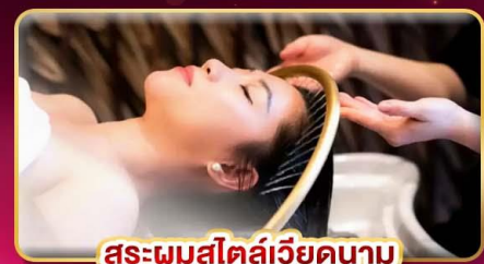
สระผมสไตล์เวียดนาม