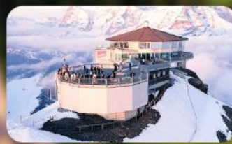
ทานอาหารที่ Piz Gloria ภัตตาคารที่หมุนได้ 360 องศา