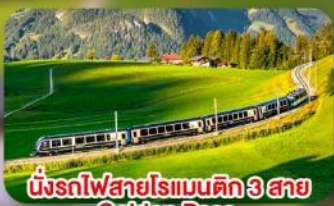
นั้รถไฟสายโรแมนติก 3 สาย Golden Pass / Luzern Interlaken Express / Gornergrat