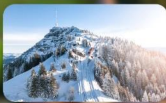
พิชิต 3 ยอดเขาดัง Rigi / Schilthorn / Gornergrat