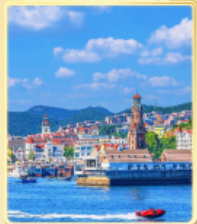
พิพิธภัณฑ์ประวัติศาสตร์หลี่ซุ่น