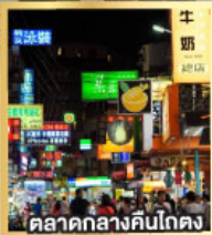
ตลาดกลางคืนโกตง