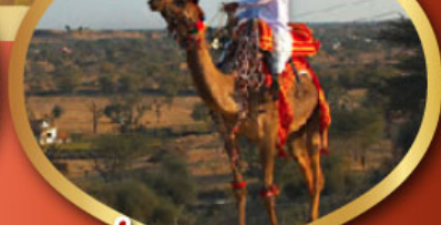
ฟรี ทัชมาฮาล เมืองมันทาวา ราคาเริ่มต้น