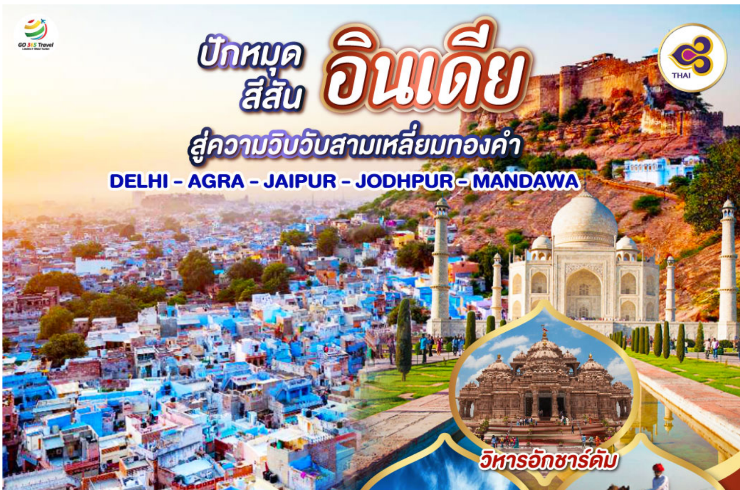
วิหารอัครดัม

DELHI - AGRA - JAIPUR - JODHPUR - MANDAWA