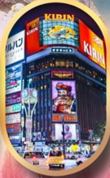
ช้อปปิ้งย่านซูซุกิโนะ