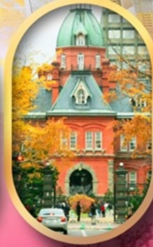
ศาลาว่าการเก่า