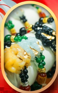
ร้านหยกอัญมณี