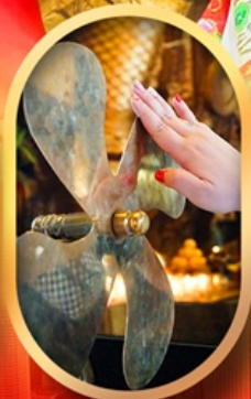
หมอนกั้งหันแซง