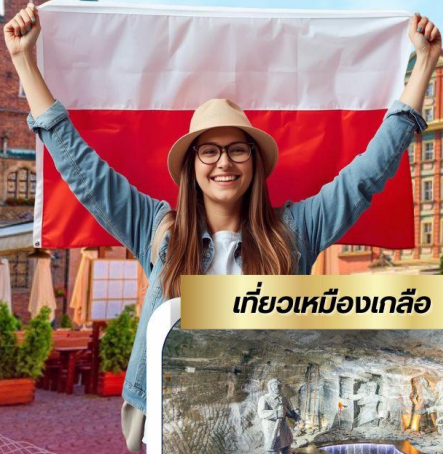
เที่ยวเหมืองเกลือ

เสน่ห์เมืองเก่าแห่งโปแลนด์ เที่ยวครบไฮไลต์ 9 วัน 6 คืน