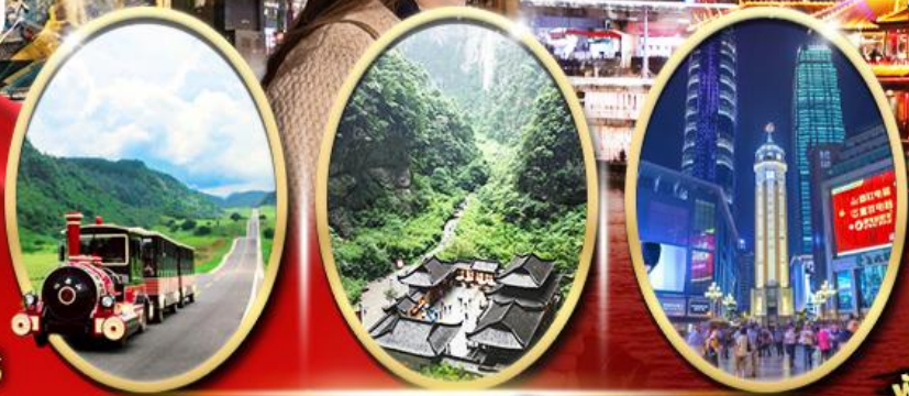
อุทยานเขานางฟ้า อุทยานหลุมฟ้า สะพานสวรรค์ ถนนคนเดินเจี่ยฟางเป็ย