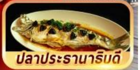
ปลาประรานาภิรมดี