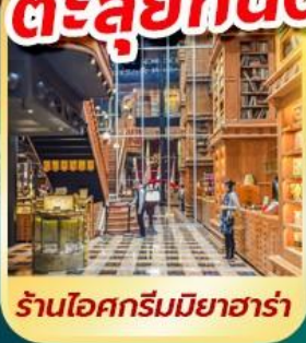
ร้านไอศกรีมมียาฮาร่า