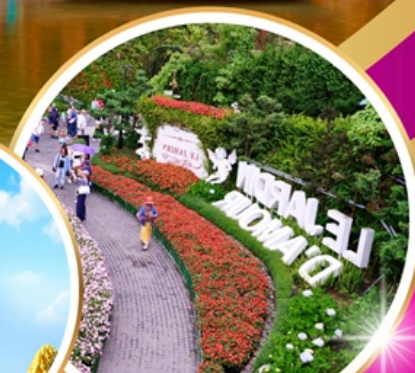
Le Jardin d'Amour