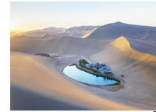
ทะเลทรายหมิงซาซาน ทะเลสาบพระจันทร์เสี้ยว

16.32 น. ออกเดินทางสู่เมืองอู๋หลู่ฟาน ด้วยรถไฟความเร็วสูง ขบวนที่ D55