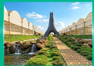
Agro Vege Farm