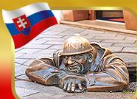
เช็คอินคู่คูมิลเมืองบาติสลาวา