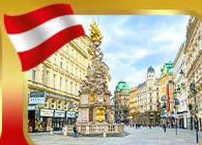
ช้อปปิ้งย่านคาร์ทเมอร์สตรีท