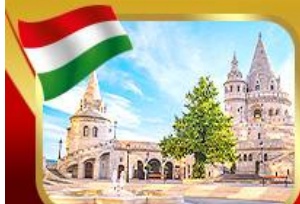
ป้อมชาวประมงเมืองบูดาเปสต์