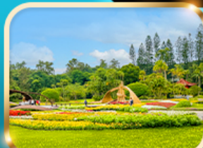
สวนบ้านปรม.เจียงไคเช็ก