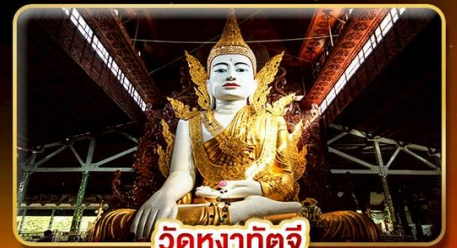
วัดหงาทัดจี