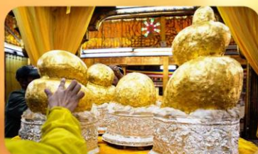
พระบิวเข้ม