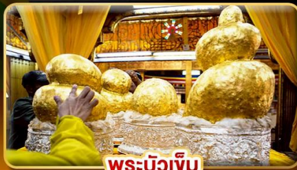
พระบิ๊วเข้ม