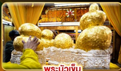
พระบัวเข็ม