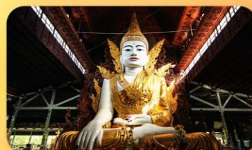
วัดหงาทัดจี