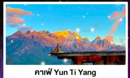
กาแฟ Yun Ti Yang