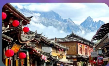
เมืองโบราณซาซี