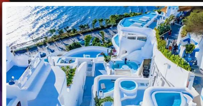
ซาไดร์นี่