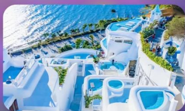
ซาโตรินี่