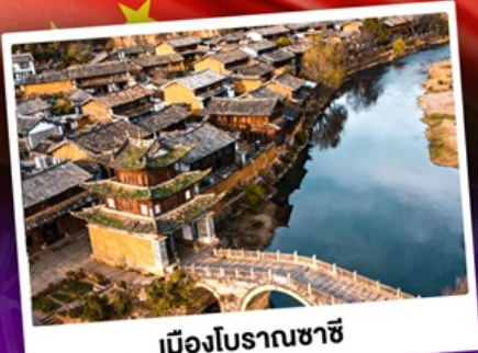
เมืองโบราณซาซี

ชมดอกไม้บานสะพรั่งทั่วยูนนาน "เซ็ดอี่นเดาเฟ่ว่วสุดอลัง"