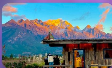
คาเฟ่ Yun Ti Yang