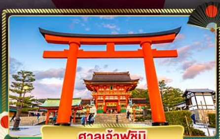
ศาลเจ้าฟูชิมิ