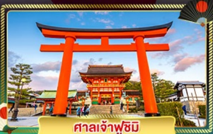
ศาลเจ้าฟูชิมิ