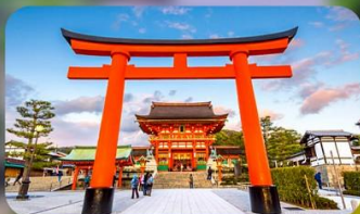
ศาลเจ้าฟูชิมิ