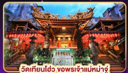
วัดเทียนโฮ่ว ขอพระเจ้าแม่มาจู