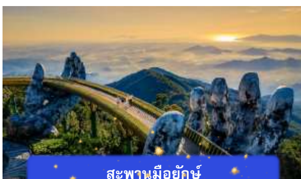
สะพานมียักษ์

เที่ยง อีสรอาหารกลางวันเพื่อความสะดวกในการท่องเที่ยว