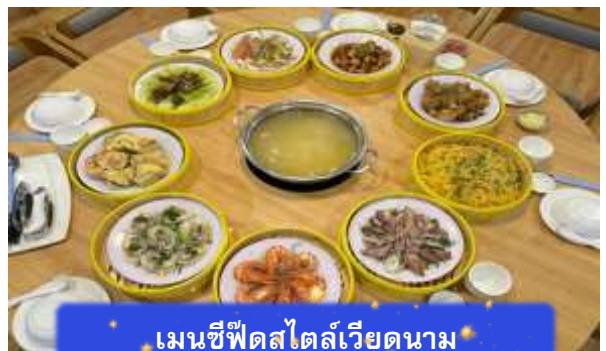
เมนูซีฟู้ดสไตล์เวียดนาม