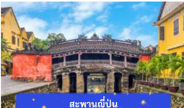
สะพานญี่ปุ่น

จากนั้นนำท่านเดินทางสู่ เมืองโบราณฮอยอัน เมืองมรดกโลกที่ยังคงเอกลักษณ์และรักษาวัฒนธรรมไว้อย่างดีเยี่ยม โดยท่านสามารถเดินเล่น ถ่ายรูป ตามตรอกซอกซอยต่างๆ ได้ ไฮไลท์ของการมาถ่ายรูประบุเช็คอินที่นี่คือการได้ขึ้นไปถ่ายรูปจากมุมสูงของคาเฟ่ที่อยู่ตามซอกซอย นำท่านชม สะพานญี่ปุ่น สะพานแห่งมิตรไมตรี ที่ได้ชื่อนี้เนื่องจากสะพานแห่งนี้สร้างขึ้นโดยชุมชนชาวญี่ปุ่น เป็นสะพานที่สร้างขึ้นข้ามคลองที่ในอดีต 400 ปีกว่าที่ผ่านมา