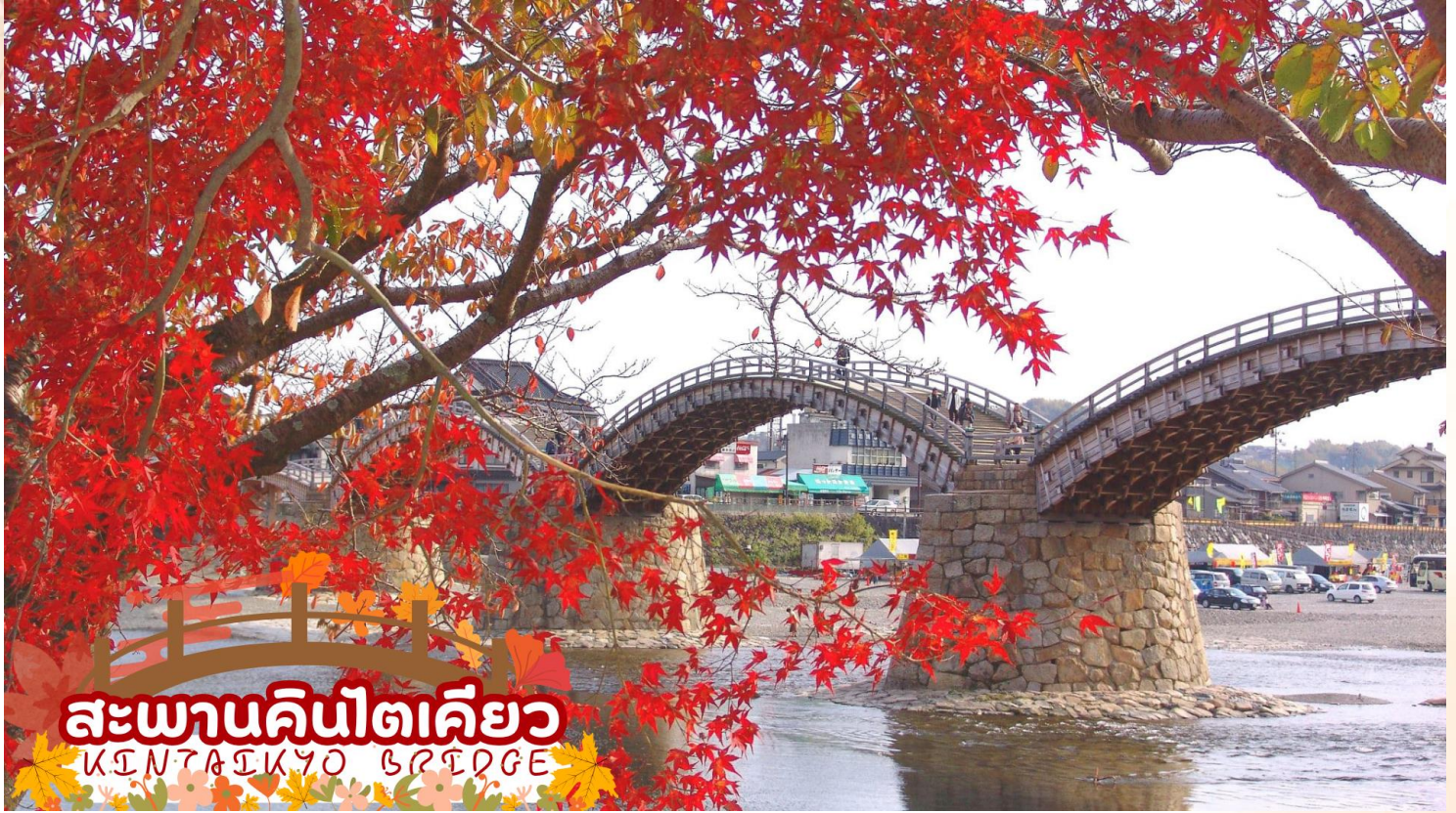
สะพานคินไตเคียว KINTAI KYO BRIDGE

ชมความงามของ สะพานคินไตเคียว (Kintai Kyo Bridge) สะพานไม้ 5 โค้ง 1 ใน 3 สะพานที่สวยงามที่สุดในญี่ปุ่น สร้างครั้งแรกเมื่อปี พ.ศ. 2216 แต่พังทลายลงในปีต่อมา จึงได้มีการสร้างขึ้นใหม่และอยู่มายาวนานกว่า 270 ปีจนกระทั่งถึง พ.ศ. 2493 สะพานแห่งนี้ได้พังทลายเพราะถูกพายุไต้ฝุ่นคิโยะพัดทำลาย ชาวเมืองอิวาคุนิเลยพร้อมใจกันสร้างสะพานขึ้นมาใหม่อีกครั้งตามรูปแบบเดิม (ใบไม้เปลี่ยนสีขึ้นอยู่กับสภาพอากาศ)