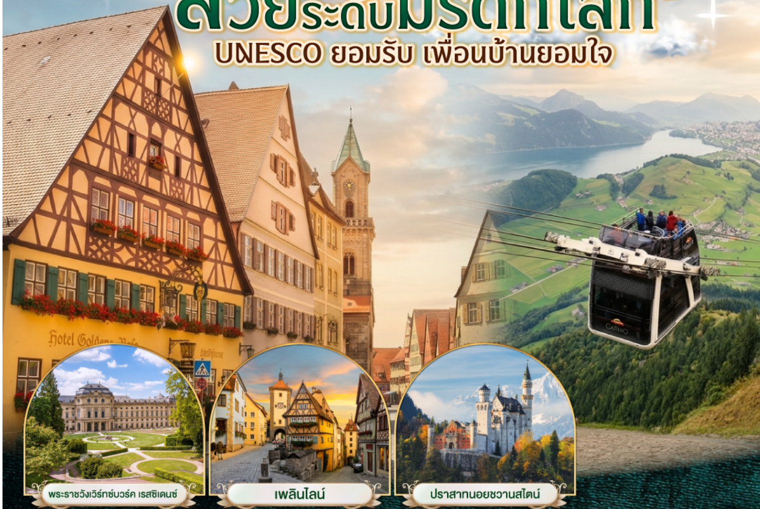
พระราชวังแวร์ซายส์ ฝรั่งเศส