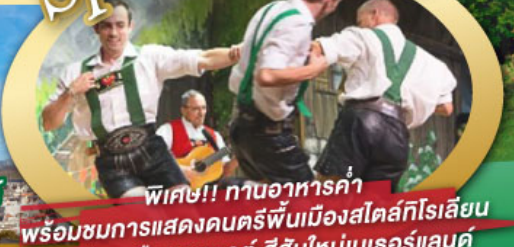
พิเศษ!! ทานอาหารค่ำ พร้อมชมการแสดงดนตรีพื้นเมืองสโตร์ทโรเลียน และเยือนเมืองอูเทรคต์ สีสันใหม่เนเธอร์แลนด์

ไฮไลท์ในโปรแกรม • เยือนเมืองแห่งแคว้นบาวาเรีย และ ทิโรล • สนุกสนานเหมืองเกลือบิรชเทสกาเดิน • เข้าชมปราสาทนอยชวานสไตน์ • เดินเล่นจัตุรัสโรเมอร์ ซอปปิง Zeil Street • ถ่ายรูปมุมสวยของหมู่บ้านอัลสติก • ชิลๆ ไปในเมืองซาลสบูร์ก บ้านเกิดโมสาร์ท 25 ก.ย. - 04 ต.ค. 69 • ล่องเรือหมู่บ้านทึร์น และ ล่องเรือชมนครอัมสเตอร์ดัม 09-18, 16-25 ต.ค. 69 • ซอปปิงจุ้ยย่านคัมสแควร์และเดินเล่นย่านโคมแดง 22-31 ต.ค. 69 / 06-15 พ.ย. 69 29 ธ.ค. 69 - 07 ม.ค. 70 * ปีใหม่ *