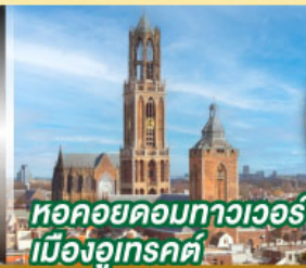
หอคอยคองทาวเวอร์ เมืองอูเทรคต์