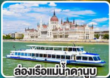
ล่องเรือแม่น้ำดานูบ