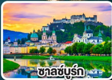
ซาลซ์บูร์ก

มือพิเศษ! เสนอร้อย เปิดบักกิ้ง , เปิดโบฮีเมีย และหมุกอดเวียนนา