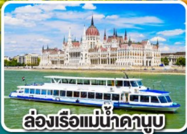
ล่องเรือแม่น้ำดานูบ