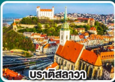
ปราติสลาวา