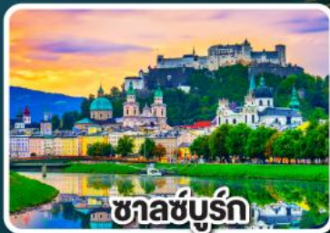
ซาลซ์บูร์ก

มือพิเศษแสนอร่อย เปิดปากกึ่ง , เปิดโบฮีเมีย และหมุกอดเวียนนา