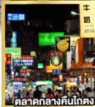
ตลาดกลางคืนโกตง