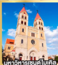
มหาวิทยาลัยเซนต์ไมเคิล