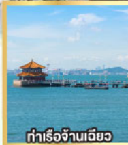
ท่าเรือจ้านเฉียว