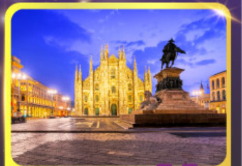
มหาวิหารคูโอโม