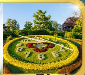
นาฬิกาดอกไม้เมืองเจนีวา

เดินทาง 9 วัน 6 คืน 09-17 ก.พ.69 22-30 มี.ย.69