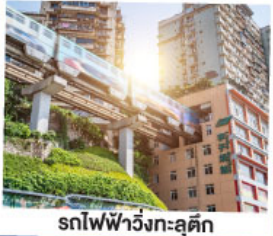
รถไฟฟ้าวิ่งทะลุคิก