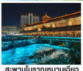
สะพานโบราณหนานเฉียว