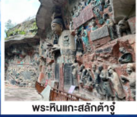
พระหินแกะสลักต้าจู้