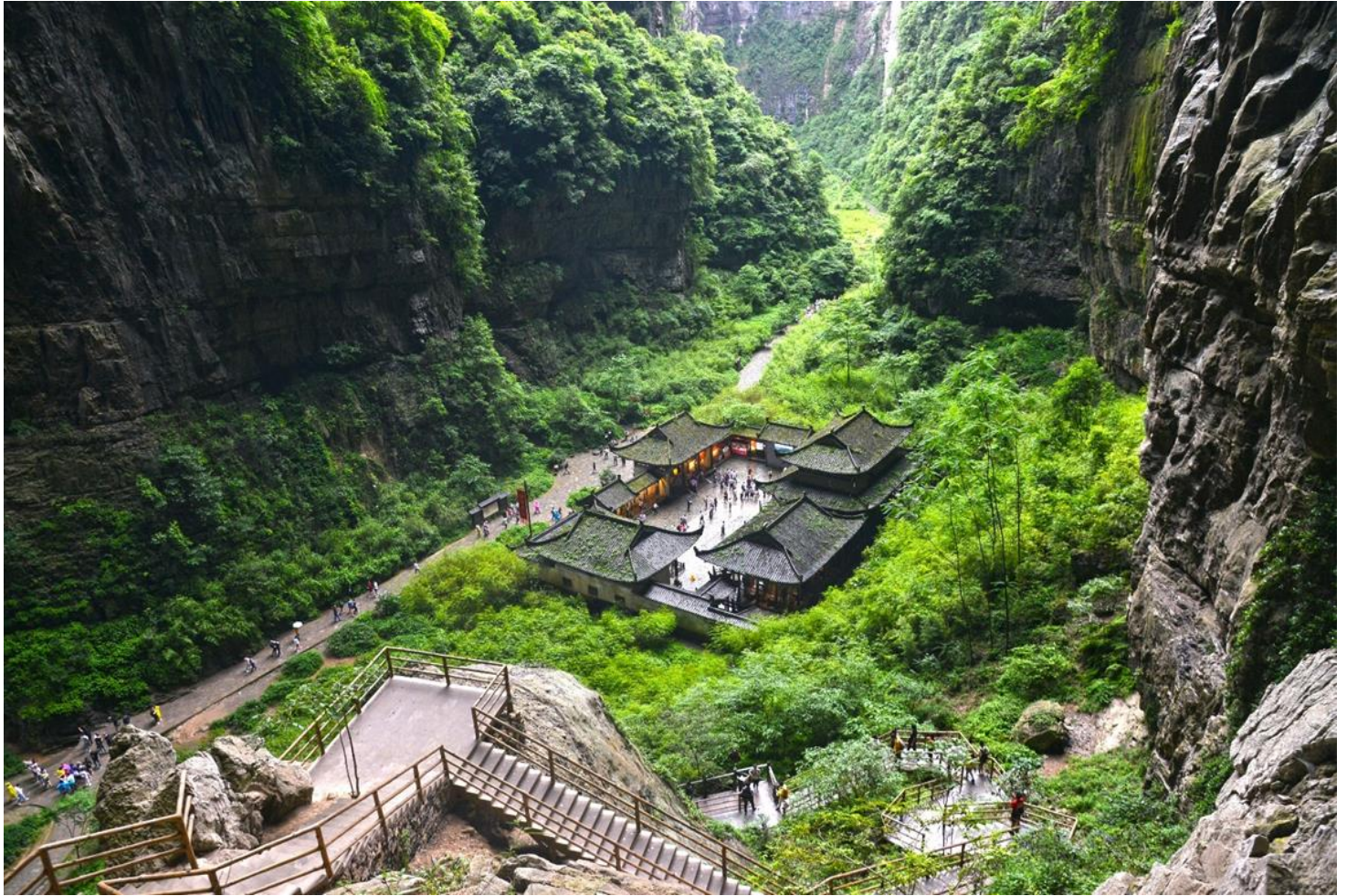
กลางวัน รับประทานอาหารกลางวัน ณ ภัตตาคาร (มื้อที่ 5)