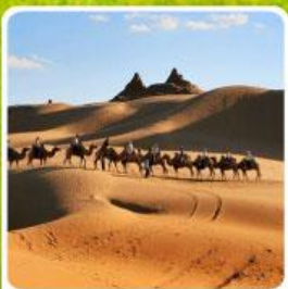
เนินทรายเสียงชาวน