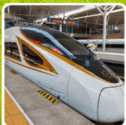
นั่งรถไฟความเร็วสูง