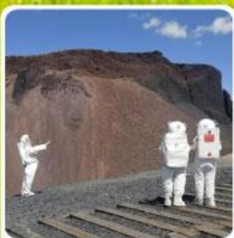
ภูเขาไฟอูลันฮาตา