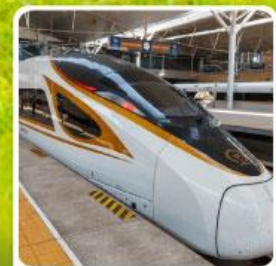
นั่งรถไฟความเร็วสูง