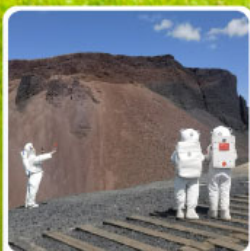
ภูเขาไฟโอลิมฮาค่า