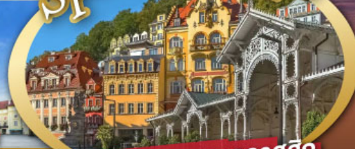
ชมสถาปัตยกรรมคลาสสิก เมือง คาร์โลวี วารี