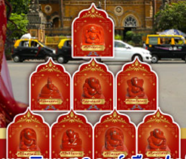
พระพิฆเนศ 8 องค์ เมืองปูเน่