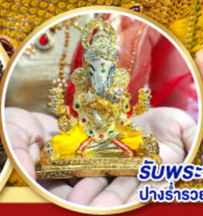
รับพระพิฆเนศ ปางรำรอย ท่านละ 1 องค์