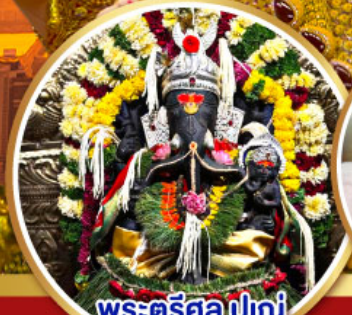
พระตรีศูล ปูเน่ (Trishul Pune)