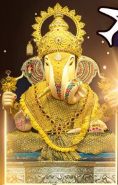
องค์ดีกษุทีพิเศษผู้