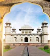
ทัชมาฮาลน้อย