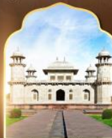
กิชมาชาลน้อย