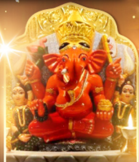
องค์สิทธินายก