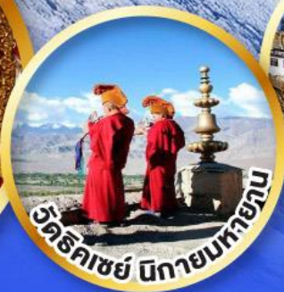
วัดริคเชย์ นิกายนิกายทิเบต