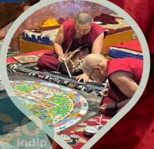
พระลามะ ผู้มีวัตรปฏิบัติ อันอัศจรรย์

ป๊อณัษดาวยทะเลสาบแปงกอง 1 ปี STAR IN THE DAILY