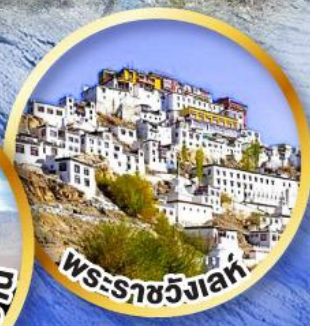
พระราชวังเลห์