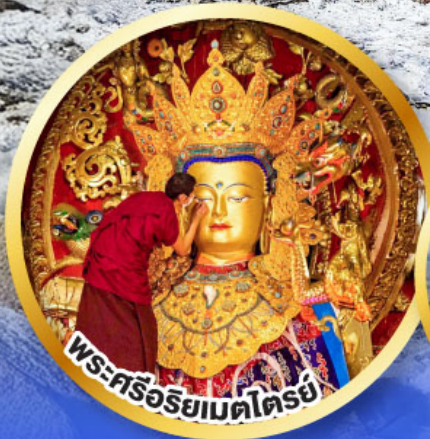
พระศรีอริยเมตไตรย์