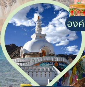
เจดีย์สันติภาพ