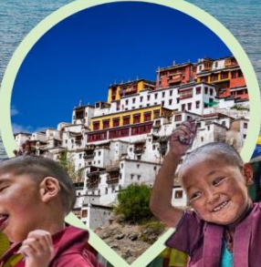
วัดริเบตนิคายมหายาน หมวกแดง หมวกเหลือง