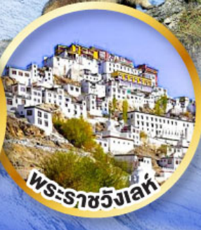
พระราชวังเลห์