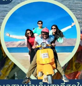
ทะเลสาบน้ำเค็มสูงที่สุดในโลก แปงกอง