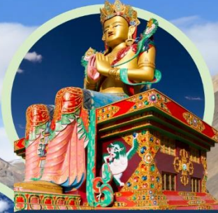
องค์พระศรีอริยเมตตรีย์