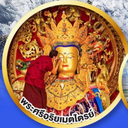
พระศรีอริยเมตไตรย์