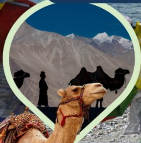
ซิลล์ ซ็อฐู ทะเลทราย กลางอ้อมกอดหิมาลัย