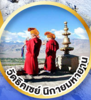
วัดทิคาชย์ นิกายนิกายทิเบต