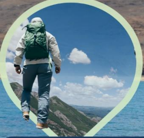
สวยสะกดทุกวิว ไปให้เห็นด้วยตาแล้วใช้ใจ...จดจำ