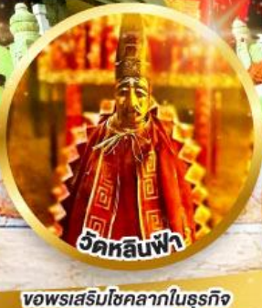
วัดหลินฟ้า ขอพรเสริมโชคลาภในธุรกิจ และการเงิน