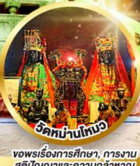
วัดหม่านโหมว ขอพรเรื่องการศึกษา, การงาน สติปัญญาและความกล้าหาญ