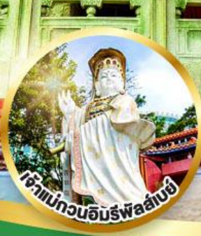
เจ้าแม่กวนอิมรัฟล่าบ่ซี่ ขอพรรับพลังงานดี เสริมพลังดวงคู่