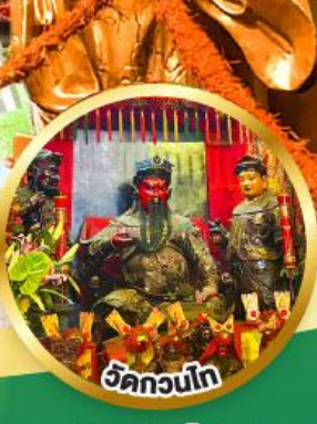
วัดกวนโก ขอพรเทพเจ้ากวนอู เงินทอง, ธุรกิจมั่นคง