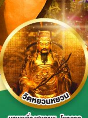
วัดหยวนหยวน ขอพรเรื่องสุขภาพ, โชคลาภ ความสำเร็จก้าวหน้า

เมนูพิเศษ! ต้มซ่าฮ่องกง, บุฟเฟต์ซาบูสไตล์ฮ่องกง, ห่านย่าง