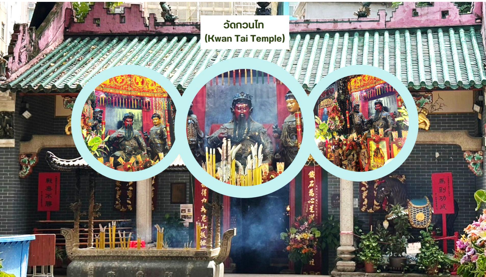
วัดกวนไท (Kwan Tai Temple)

จากนั้นนำท่านเดินทางสู่ วัดกวนไท (Kwan Tai Temple) สร้างขึ้นในปี 1891 เพื่อบูชาเทพเจ้ากวนอู ซึ่งเป็นเทพเจ้าแห่งความซื่อสัตย์ และเปี่ยมไปด้วยคุณธรรม ภายในวัดมีรูปปั้นกวนอูขนาดใหญ่ตั้งอยู่ที่แท่นบูชา มีผู้คนจำนวนมากมาสักการะท่านกวนอูเพื่อขอพรให้ประสบความสำเร็จในธุรกิจ เรื่องความโชคดี โชคลาภ การค้าขาย และการปกป้องคุ้มครอง