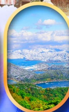
ทะเลสาบมิกะตะ