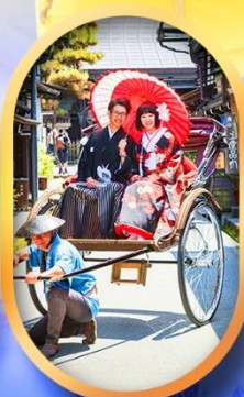
ศาลเจ้าจิ้งจอก