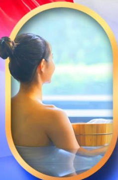
พักโรงแรมออนเซ็น