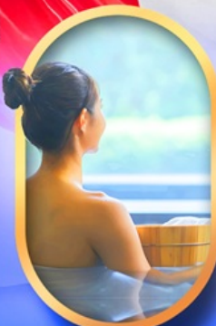
พักโรงแรมออนเซ็น