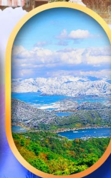
ทะเลสาบมิกะตะ