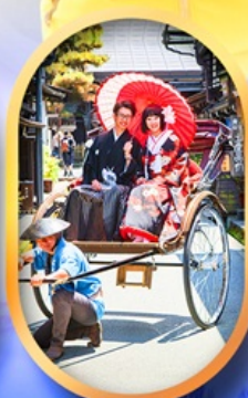
ศาลเจ้าจิ้งจอก