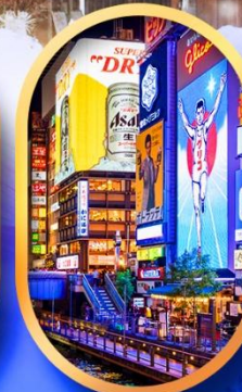
ย่านชินโซบาชิ