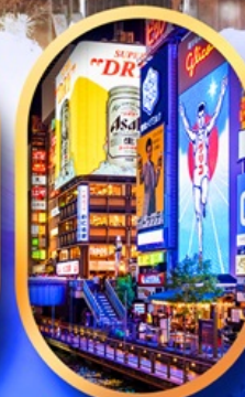
ย่านชินโซนาชิ