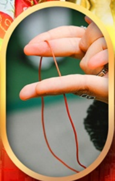
เสริมดวงความรัก