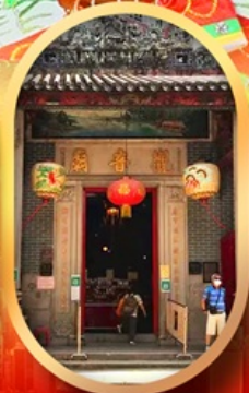
เจ้าแม่กวนอิมสองอ่า