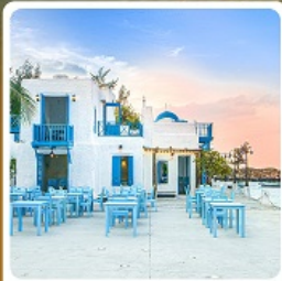
บาร์น้ำคาเฟ่