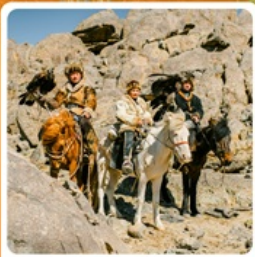
ชาวมองโกล