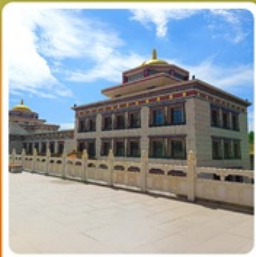
ทำเนียบพระลามะอุหลาน