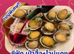
ซีฟู้ด เป้าฮ้อ+ไวน์แดง