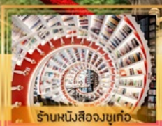
ร้านหนังสือจตุเก๋