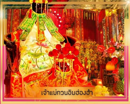
เจ้าแม่กวนอิมองค์อำ