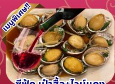
ซีฟู้ด เป้าซือ-ไวน์แดง