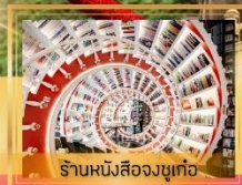
ร้านหนังสือจุกเก้อ