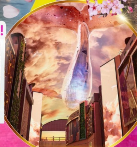
Aurora Media Art

ชมศิลปะดิจิทัลสุดล้ำ บนจอ LED เสมือนจริงขนาดยักษ์ อิสระช้อปปีงย่านดัง คังนัม เมียงดง ฮงแด ซองซู ช้อปปลอดภาษี Lotte Duty Free