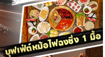
บุฟเฟ่ต์หม้อไฟหลงซิง 1 มื้อ