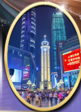
ถนนคนเดินเจี๋ยฟางเป็ย