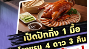
เปิดปิกทัง 1 มื้อ พักรีสอร์ท 4 ดาว 3 คืน

ไฮไลท์ สุดจ้าว! ขึ้นลิฟท์แก้วชมความอลังการ กลางหุบเขา