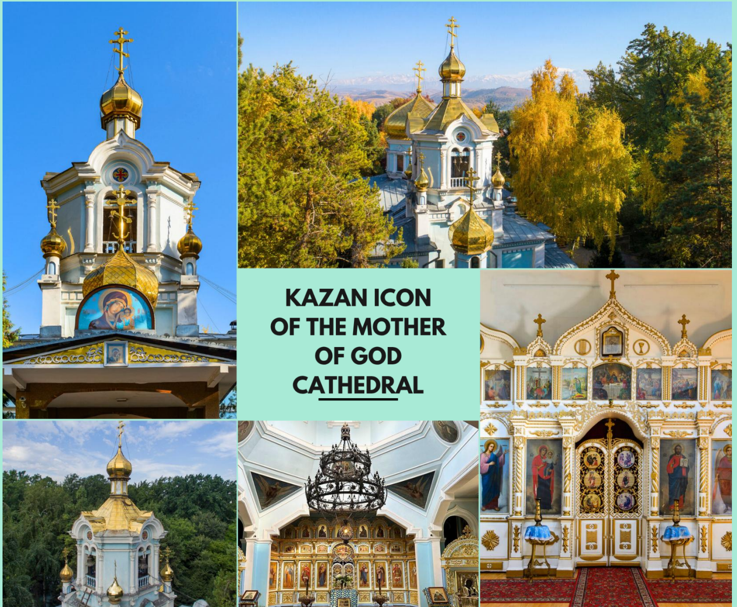
KAZAN ICON OF THE MOTHER OF GOD CATHEDRAL

นำท่านชม โบสถ์ไต้ดินดาซา (Kazan Icon of the Mother of God Cathedral) สภานที่ศักดิ์สิทธิ์ลึกลับไต้ดินแห่ง เมืองอัลมาตีถูกซ่อนอยู่ในถ้ำไต้ดิน สร้างขึ้นโดยฝีมือช่างชาวรัสเซียในช่วงต้นศตวรรษที่ 20 เพื่อเป็นสภานที่ประกอบ พิธีกรรมทางศาสนา ด้านในโบสถ์ตกแต่งด้วยภาพจิตรกรรมของชาวคริสต์นิกายออร์ทอดอกซ์ บรรยากาศเย็นสงบ และ เต็มไปด้วยมนต์ขลัง ( การเปลี่ยนสีของใบไม้ขึ้นอยู่กับสภาพอากาศ )