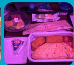
บริการอาหารร้อน ทั้งขาไป และ ขากลับ