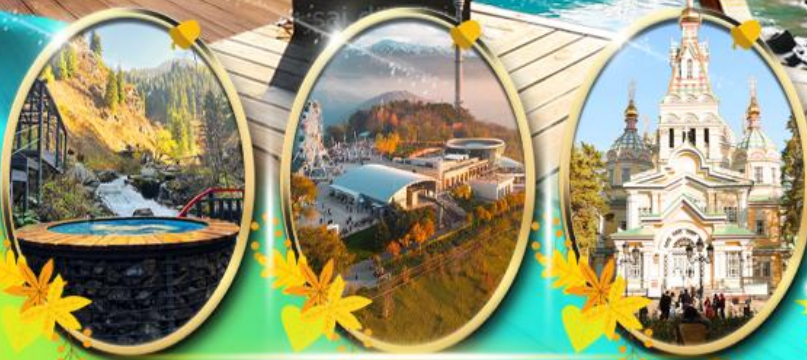
Alma Arasan Gorge Kok Tobe Zenkov Cathedral

เที่ยวครบทุกไฮไลท์ กรุ๊ป 15 ท่าน ไฮไลท์ พิเศษ! พักโคลโศ 1 คืน พักอัลมาตี 3 คืน