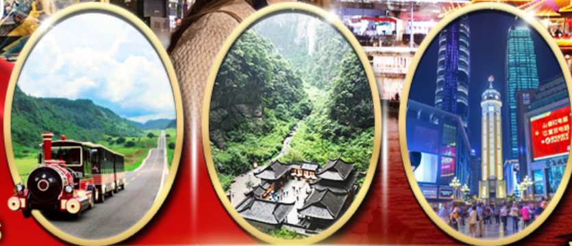
อุทยานเขานางฟ้า อุทยานหลุมฟ้า สะพานสวรรค์ ถนนคนเดินเจี๋ยฟางเป่ย์