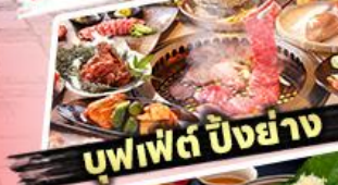
บุฟเฟต์ ปิงย่าง