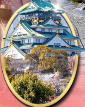
ฟาร์ม วาซาบิ ไดโอะ ซอปปิง ซินโซบาชิ ปราสาทโอซาก้า