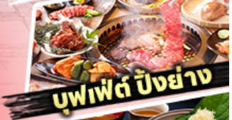
บุฟเฟต์ ปังย่าง