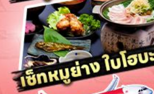
เช็กเอาท์ ใโฮะ