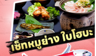
เช็กนุ้ย่าง ใบโอบะ